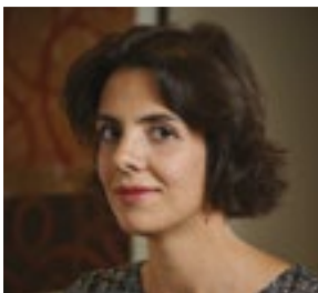
Par Sarah Guéreau Associée Crowe Horwath Dauge et Associés

“ La RSE constitue un levier de compétitivité efficace et un axe de développement. ”