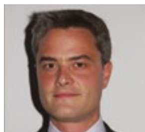
Par Jean-Baptiste Cottencaeu Associé Crowe Horwath Sustainable Metrics

À l'heure de la COP 21 à Paris, tout a été dit, ou presque, sur la hausse du thermomètre mondial, signe du changement climatique en cours, et sur l'absolue nécessité de modifier nos habitudes afin de réduire nos émissions de carbone. Nous le savons, cela passe par le développement de sources d'énergies alternatives aux énergies fossiles. Cela passe aussi et, plus largement, par un changement d'état d'esprit pour inscrire nos activités dans une